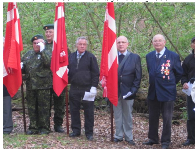
Fanerne holdes højt