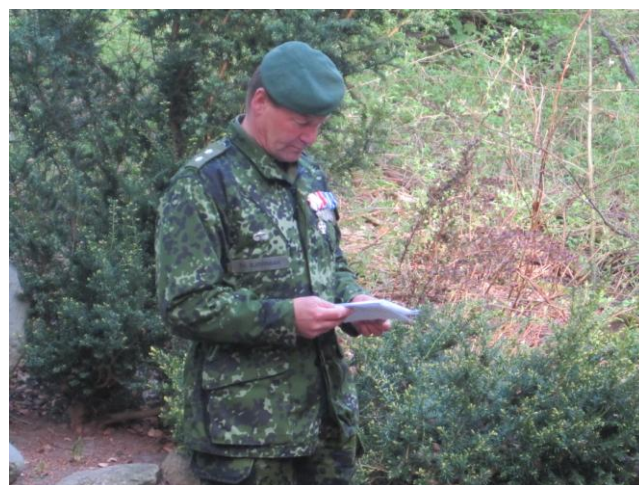
Talen ved mindehøjtideligheden