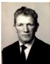
En ung mand