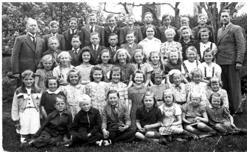
jeg er den lille lyshårede dreng, der sidder som nr. 2 fra venstre.