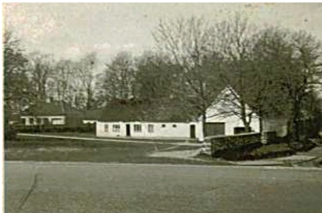
Beboelsen på forpagterstedet.

Jeg er ikke "et barn af Gunderup", eftersom jeg ikke blev født der. Men byen og den gamle skole var fra 1947 til 1957 hele mit univers. I år er det 50 år siden det ændredes.