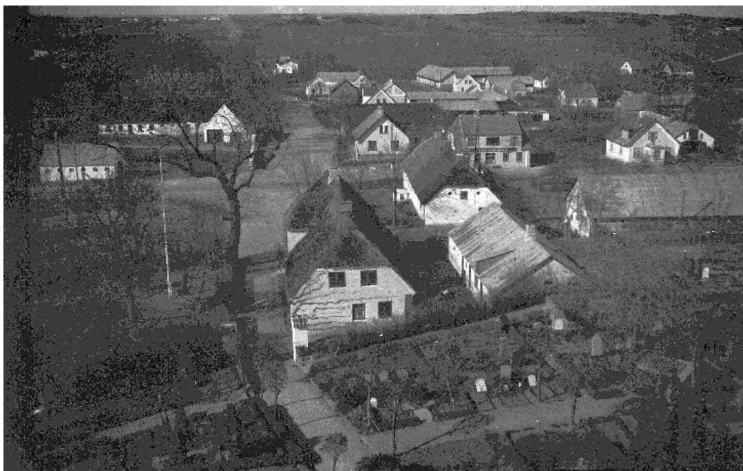
Her ses forpagterstedet til venstre i billedet.