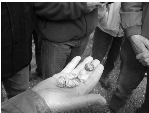
Kugler fra slaget ved Lundby